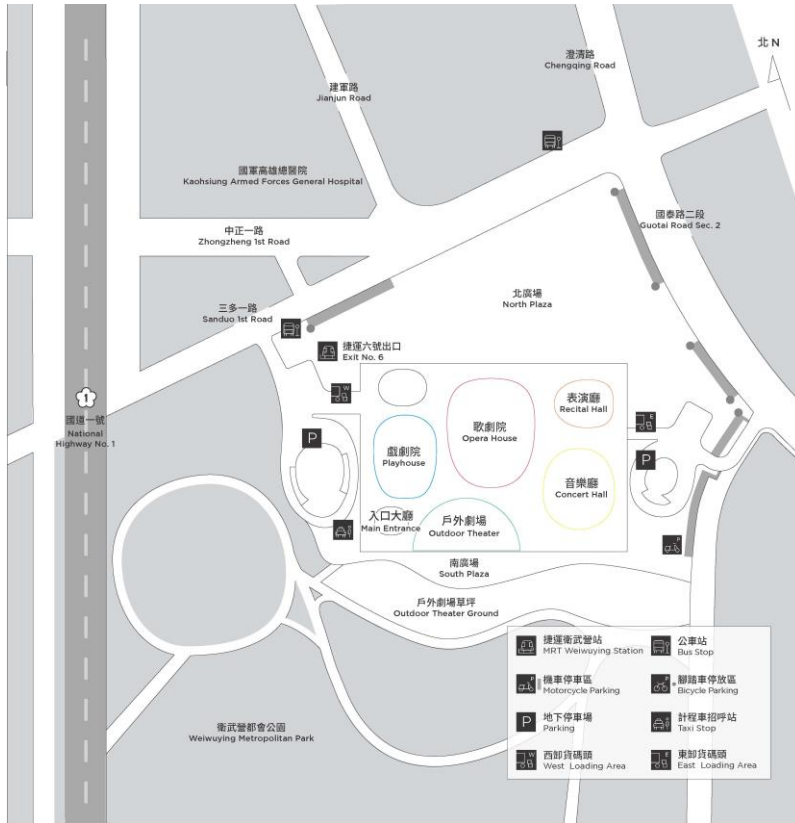
公共區域範圍示意圖(附圖一)