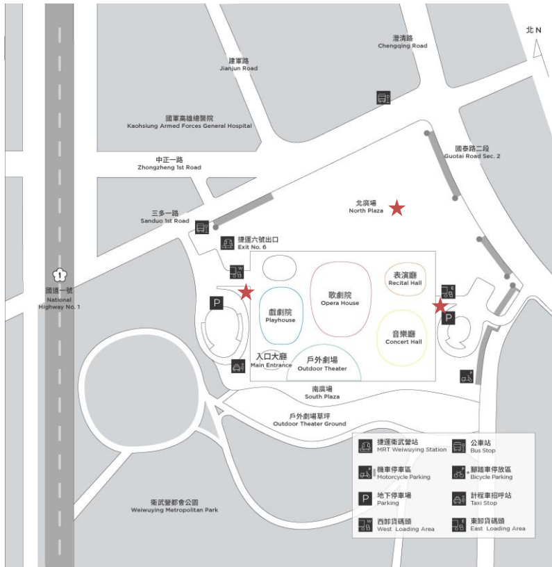
★ 吸菸區域範圍 公共區域範圍示意圖(附圖一)