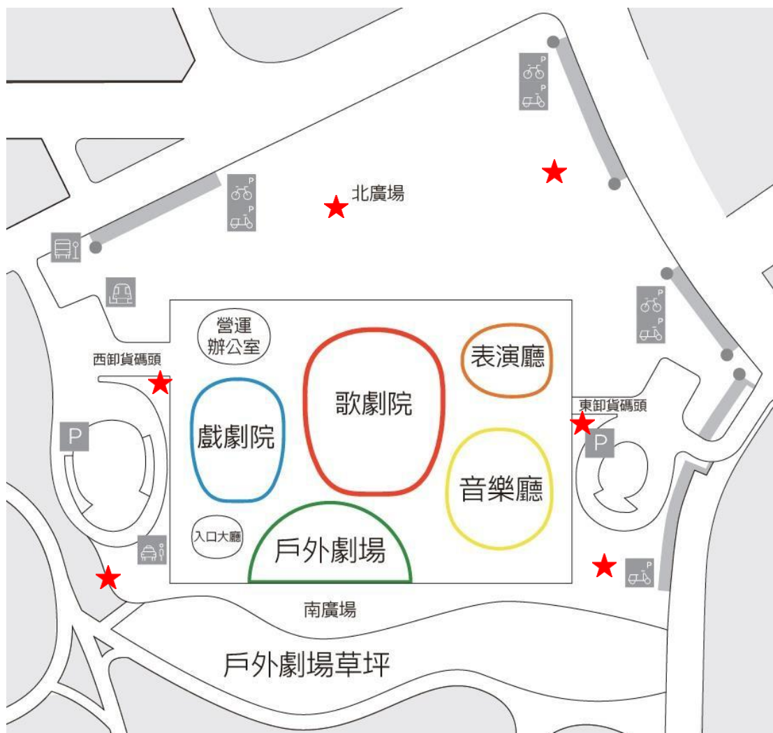
★ 吸菸區域範圍 公共區域範圍示意圖（不含道路）（附圖一）