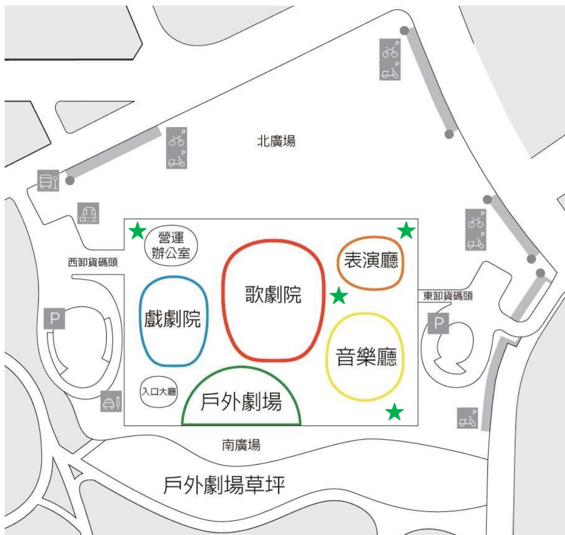
★ 為榕樹廣場使用自備播音設備位置 榕樹廣場指定使用自備播音設備區域示意圖（附圖二）